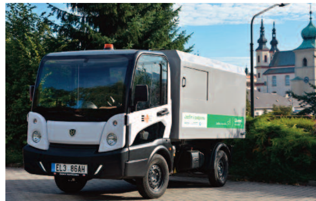
MODERNIZACE VYBAVENÍ. Pro městské služby, domov seniorů a další příspěvkové organizace.