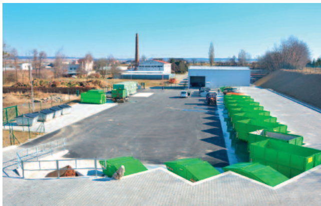
ROZŠÍŘENÝ SBĚRNÝ DVŮR. Snadno a zdarma se v něm můžete zbavit většiny odpadů.