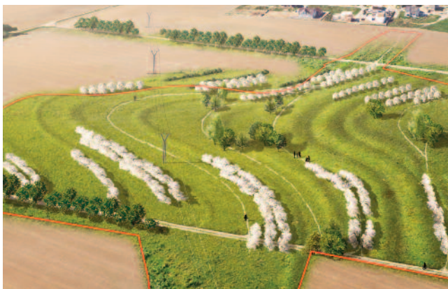
NOVÝ PARK NA Z. KOPALA. Stovky stromů a další zeleně, zároveň pomůže zadržet vodu v krajině.