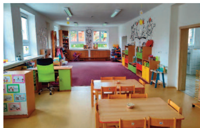
INVESTICE DO MÍSTNÍCH ŠKOL A ŠKOLEK. Stavební úpravy i nové vybavení za více než 60 milionů.