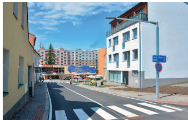
OPRAVY ULIC A CHODNÍKŮ. Například kompletně rekonstruovaná Zahájská či okolí hřbitova.