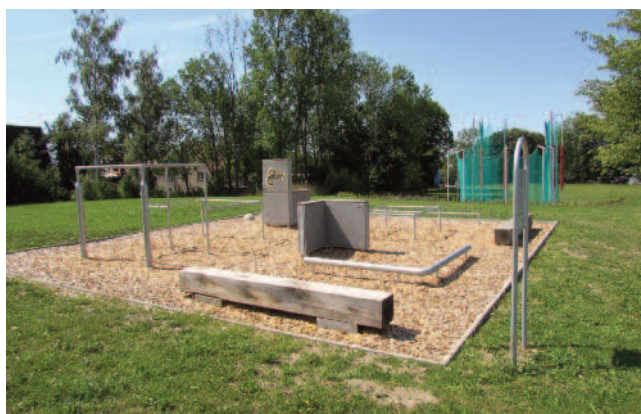
ÚDRŽBA A ROZVOJ SPORTOVIŠŤ. Vznik discgolfového hřiště a modernizace na atletickém stadionu.